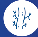
Ailede genç yaşta kalp damar hastalığı