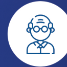
Yaş ve Erkek Cinsiyet